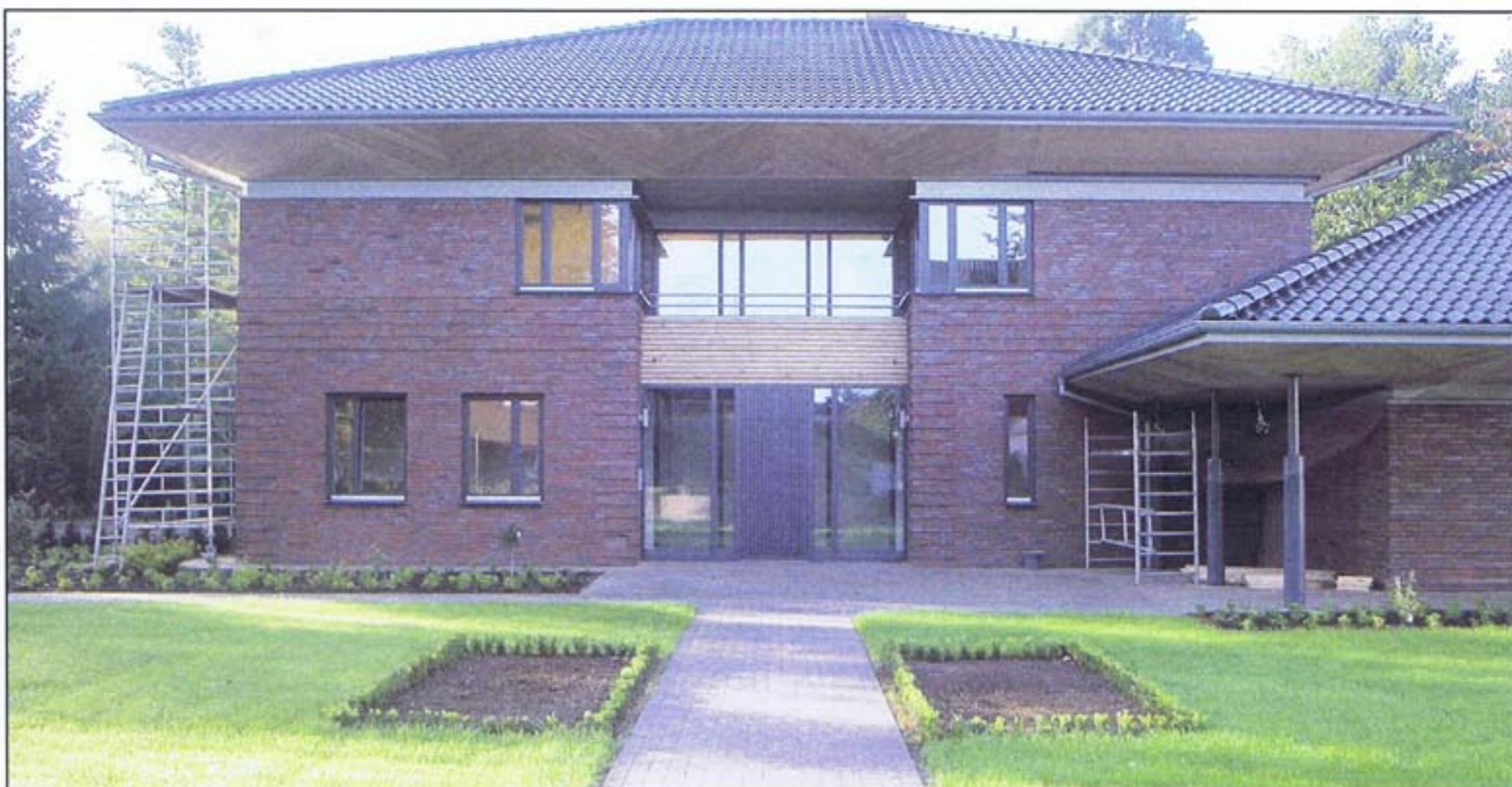
Architektin Suse Bertzbach überwachte die ordnungsgemäße Ausführung der Arbeiten.