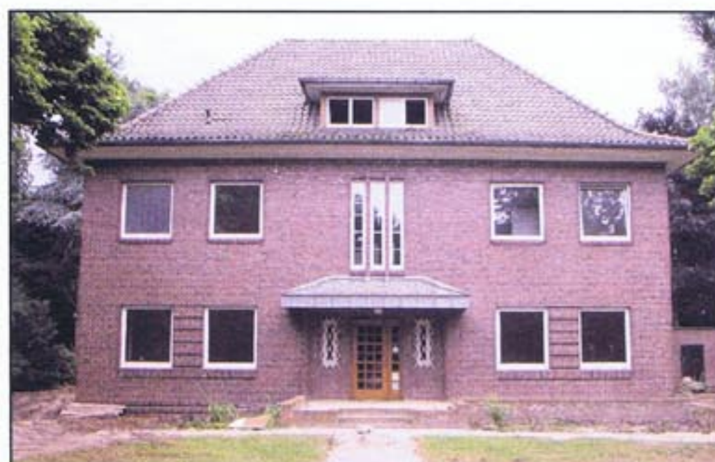
Das alte Pfarrhaus ist 1935 gebaut worden und hätte aufwändig saniert werden müssen.