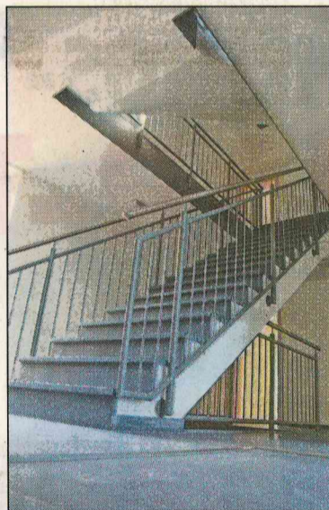
Großzügig verglaste Treppenhäu- ser lassen viel Licht in die Gebäu- de und heben optisch die Eingän- ge der Häuser hervor.

Herzlichen Glückwunsch zum gelungenen Projekt!